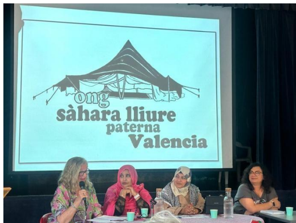
Campanyes de difusió