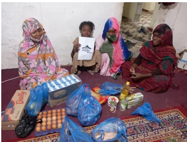
Cistelles alimentació famílies