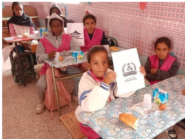
Desdejunis en escoles