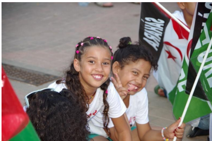
Vacances en Pau