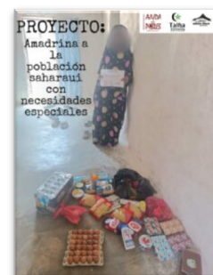
Ejemplos de algunas de las entregas realizadas

La noticia a la que hacemos referencia en el párrafo anterior es que empezaron a llegar alarmas sobre la poca cantidad de comida que quedaba en la Media Luna Saharauí, la organización interna en los campamentos que se encarga de almacenar y canalizar la ayuda humanitaria que llega. Si cada vez, y es tendencia, llegan menos alimentos a la población saharauí refugiada, en este año y por la repercusión de la guerra en Ucrania, los alimentos y los medios para transportarlos, se han encarecido enormemente, lo que no hace falta explicar mucho ya que se evidencia diariamente en la compra que realizamos para nuestros hogares.