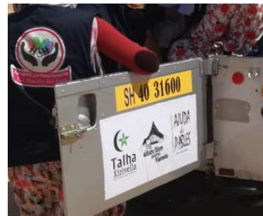
ENTREGAS DE MEDICAMENTOS