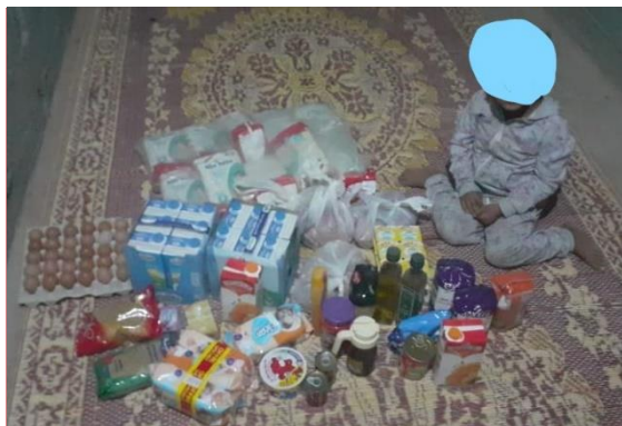
5 DICIEMBRE CENTRO DIVERSIDAD FUNCIONAL