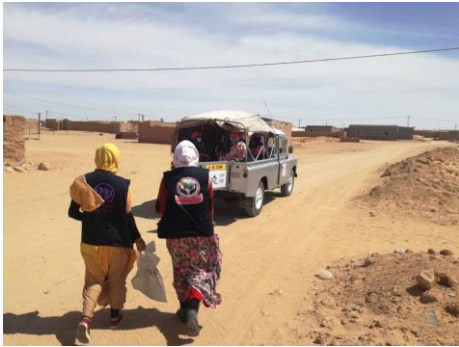
AUTOMÓVIL ADQUIRIDO ENTRE LAS TRES ASOCIACIONES